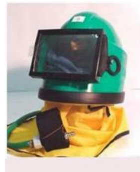
Avec chasuble nylon

Casque de sablage avec fenêtre rectangulaire (115 x 165 cm) équipé d'un écran en polycarbonate avec écrans de protection jetables.