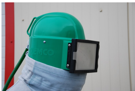
Avec chasuble cuir